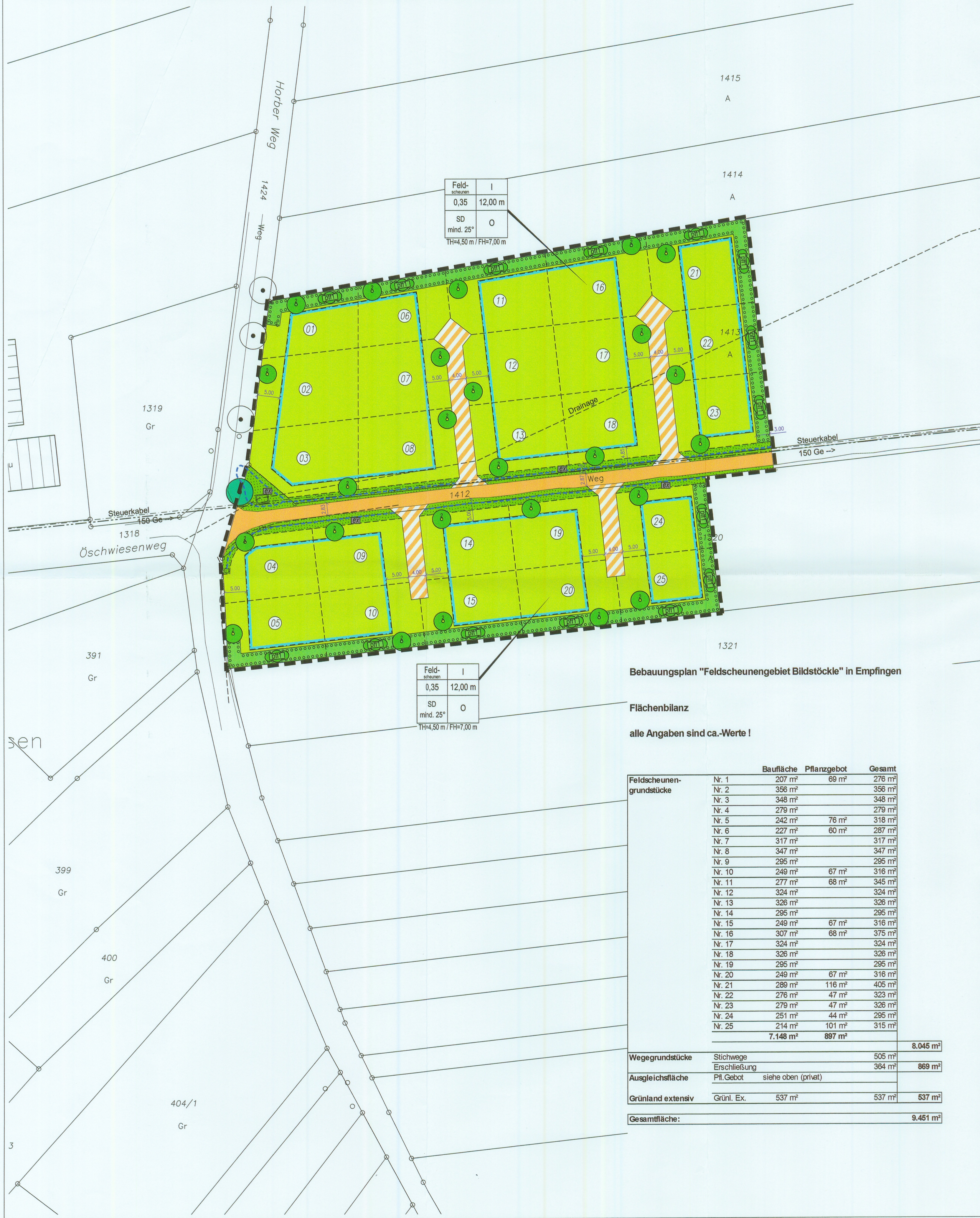
Bebauungsplan "Feldscheunengebiet Bildstöcke" in Empfingen