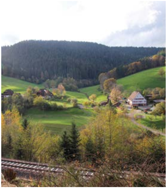
Der Geschichtslehrpfad „Historischer Eisenbahnerweg“ Zeitreise entlang der Kinzigtalbahn. Das Ehlenbogener Tal hat durch die Eisenbahn-Erschließung und dem damit verbundenen Ende der Flößerei eine einschneidende Veränderung in seiner Geschichte erlebt.

Die Klosterstadt verfügt über zahlreiche romantische Ecken und versteckte Sehenswürdigkeiten, die nur darauf warten, entdeckt zu werden. Als regional einzigartige Tourismus-Highlights strahlen sowohl die Klosterbrauerei mit der Brauwelt als auch die Klosterkirche als Wahrzeichen und kultureller Mittelpunkt vieler Veranstaltungen und Events über die Landkreisgrenzen hinaus. Alpirsbach... Viel drin. Viel draußen. Feel good.