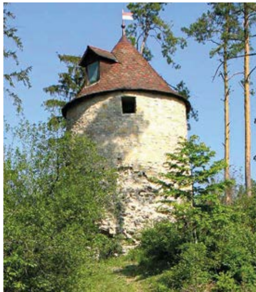
Urnburger Ruine Tauchen Sie ein in das 14. Jahrhundert und entdecken Sie die Besonderheiten der Ruine Urnburg.