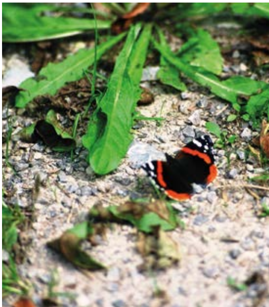
Naturhistorischer Wanderweg Eutinger Tal Schmetterlinge im Bauch – im Landschaftsschutzgebiet Eutinger Tal entdecken Sie u. a. Schmetterlingshänge, Fledermauskeller, sowie die Ruine des Rittergutes Eutinger Tal.

Eutingen im Gäu - Heimat erleben zwischen Alb und Schwarzwald. Die Gemeinde ist wunderschön gelegen auf der Gäuhochebene unmittelbar nördlich des oberen Neckartals.