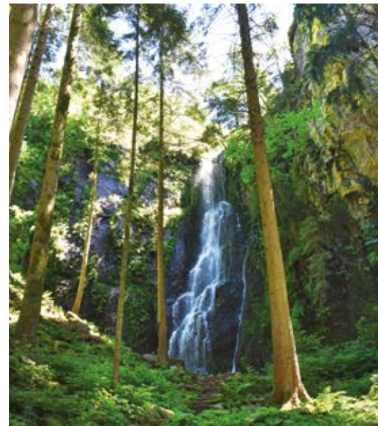
Burgbachwasserfall Der Duft von Wasser zieht uns hin zu einem atemberaubenden Naturspektakel: dem Burgbachwasserfall. Er ist mit einer Gesamt- höhe von 32 Metern und einer freien Fallhöhe von 15 Metern einer der höchsten freifallenden Wasserfälle in Deutschland.

Bad Rippoldsau-Schapbach – Kleines Dorf mit großem Herzen: Natur pur in der Nationalparkregion Schwarzwald.