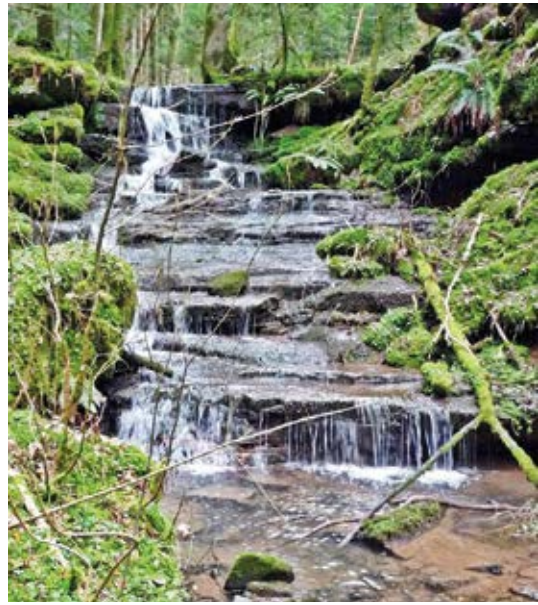
Der Gräbenbach-Wasserfall ist perfekt geeignet für eine schöne Wanderung. Moos, Farn, Ruhebänke - eine wunderbare Umgebung, um besonders an heißen Sommertagen abzukühlen und auszuruhen.