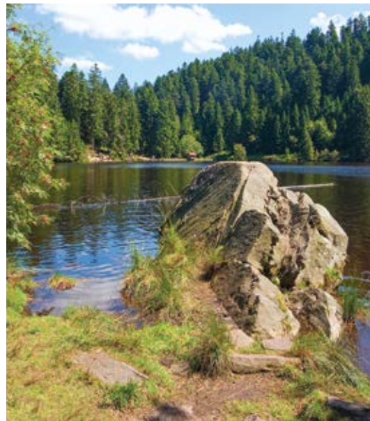
Glaswaldsee – ruhig, klar und rein Umgeben von Wänden aus Wald liegt der See im Berg des Glaswaldes. An Sommertagen, wie auch an Wintertagen – man wirft nur einen Blick auf den See und schon zieht er Sie in seinen Bann. Ausgehobelt von einem Gletscher der letzten Eiszeit.