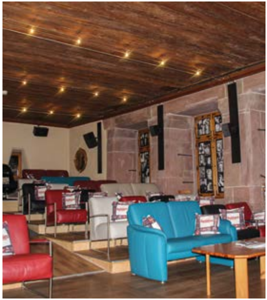
Das Subiaco Kino im Kloster lädt zu einem außergewöhnlichen Filmprogramm an einem außergewöhnlichen Ort ein. Auf den Sesseln und Sofas im früheren Wohnzimmer des Klosterabtes kann man bei täglichem Spielbetrieb neue Filme entdecken.