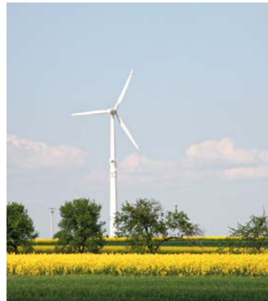
Energielehrpfad Immer mit dem Strom – auf dem Lehrpfad entdecken Sie alle gängigen Produktionen mit erneuerbaren Energien.