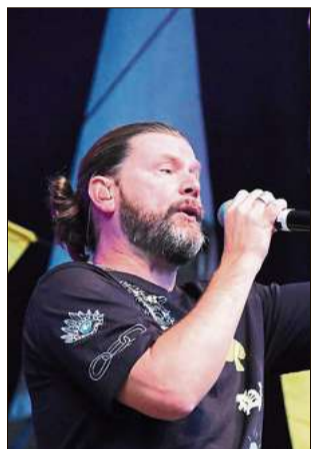
Der irische Superstar Rea Garvey

Wer bei der ersten Auflage 2019 mit dabei sein durfte, weiß genau welches Highlight ansteht, denn der erste Feiertag war ein voller Erfolg.