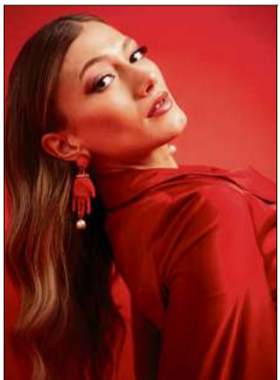
Freuen dürfen sich die Besucher am Samstagabend auf Leony.

An den Festtagen hat Truffner drei musikalische Ausnahmekünstler nach Empfingen gelockt. Über welche Höhe-