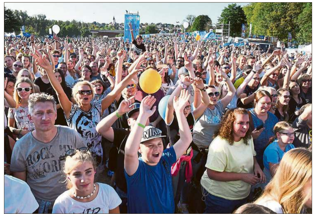
Beste Stimmung herrschte beim Feiertag 2019.

Außerdem wird das Duo »Seiler und Speer« für gute Laune bei den Besuchern sorgen. Die Geschichte der Beiden ist besonders. Vom Spaßprojekt entwickelte sich das Ganze zum