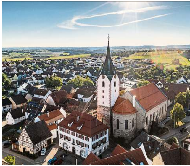
Ein schöner Blick auf die Empfinger Dorfmitte.

F wie Ferdinand Truffner: Schindlers Nachfolger ist ein